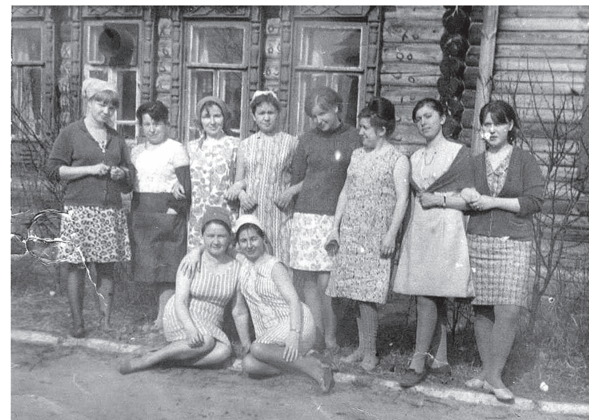
На производстве бережно хранят архивные фотографии. На них запечатлены первые сотрудники на фоне старого деревянного здания, 1960-е.