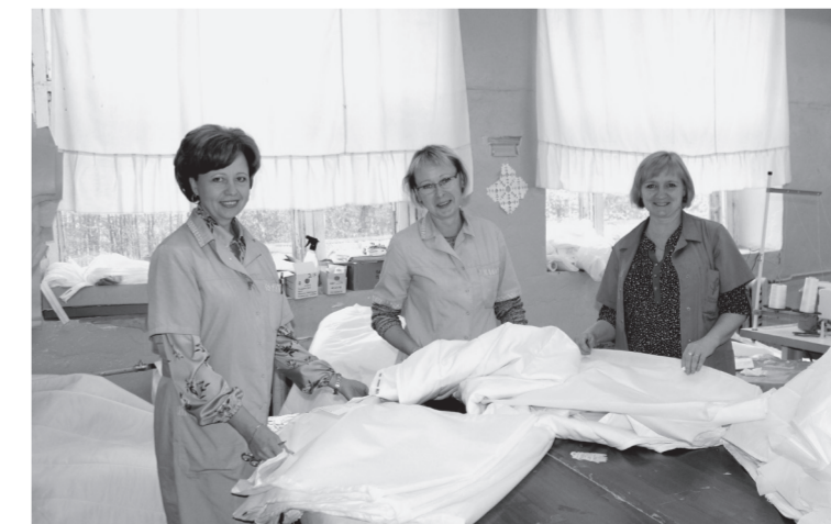
Доброжелательные взаимоотношения в коллективе помогают преодолевать все трудности и создают комфортные условия для работы.