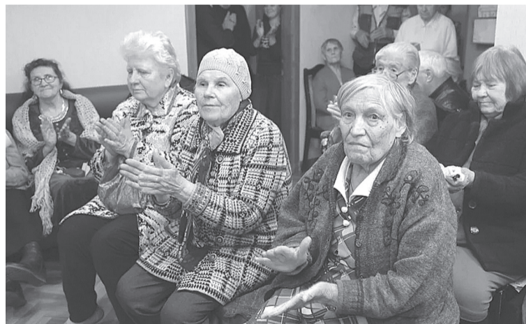
На праздничном концерте

Алексееву Лидию Михайловну Антипова Вячеслава Васильевича Белову Лидию Сергеевну Иванову Римму Михайловну Кузнецову Марию Ивановну Мальшеву Валентину Васильевну Николаевича Клавдию Ивановну Хайруллину Миникамал Ахметовну