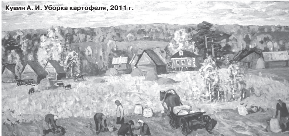
Кувин А. И. Уборка картофеля, 2011 г.

дями кустарников, начали осваиваться и другие живописцы. Среди них был и народный художник РФ Владимир Иванович Рузин, положивший начало русскому Барбизону. Так сложились предпосылки создания в этих местах нового художественного направления.