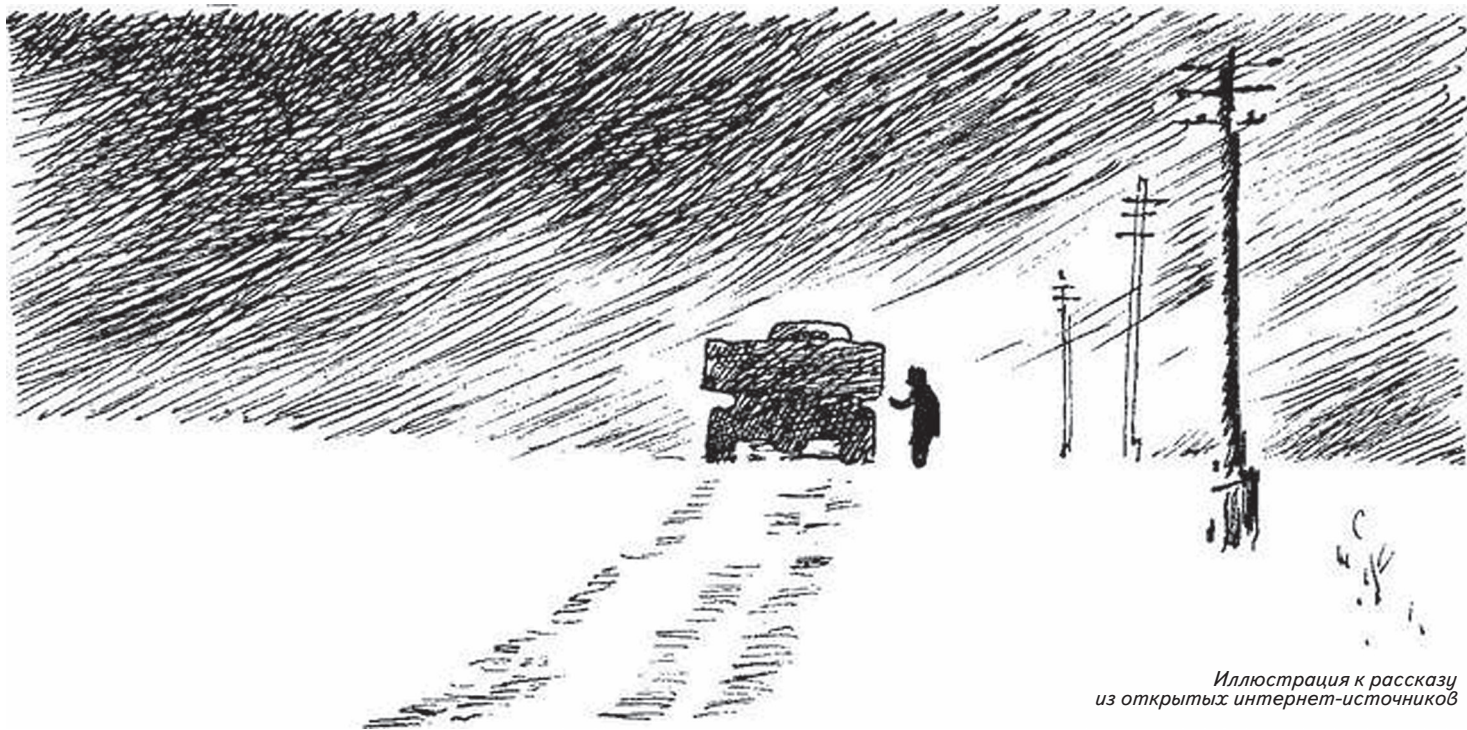
Иллюстрация к рассказу из открытых интернет-источников

пайка ребятам хватало на один раз поесть. Разнообразная еда продавалась на базаре, но там за булку хлеба пришлось бы отдать всю стипендию. Не голодал только один студент, которого звали Мишка. Его отец работал на складе, и он каждую неделю привозил сыну продукты. Но Мишка этими продуктами ни с кем не делился, хранил их под замком в своей тумбочке и ел по ночам, тайком. Ребятам ничего не стоило разбить его тумбочку, тем более что они знали, как это можно сделать с одного удара. Но никому из них и в голову не приходило взять чужое без разрешения. Однажды праздни-