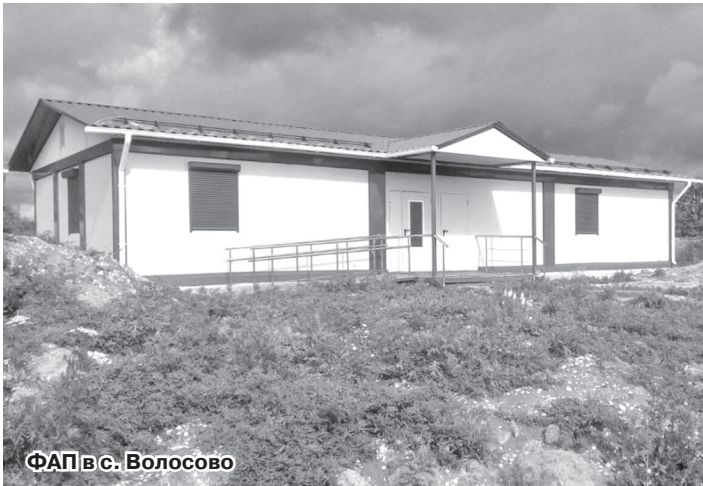
ФАП в с. Волосово