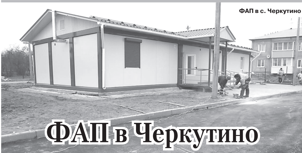
ФАП в с. Черкутино